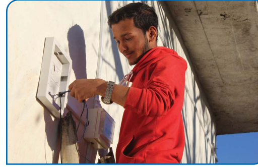
हाउस वाइरिङ्ग तालिम पछि स्वरोजगारमा लागेका युवा