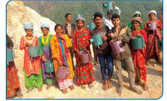
धुवा रहित चुल्हो सहयोग