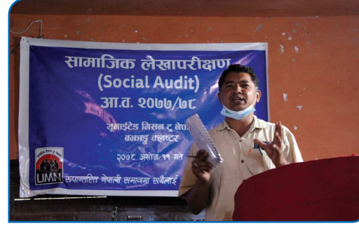
सामाजिक लेखा परिक्षण २०७७/७८ को सहजीकरण गर्दै