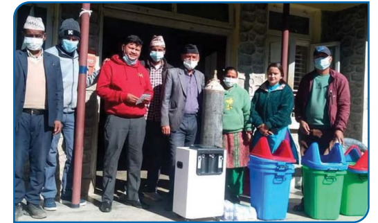
स्वास्थ्य संस्थाहरूलाई कोभिड सुरक्षा तथा मेडिकल सामान सहयोग