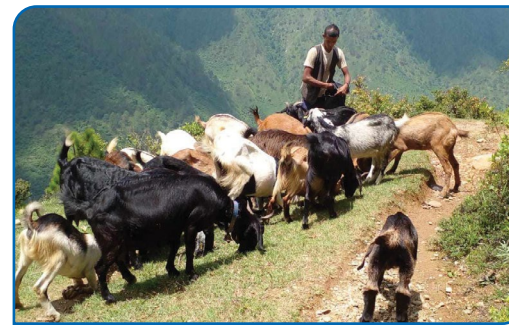
बाखापालनमा युवा रोजगारी सृजना