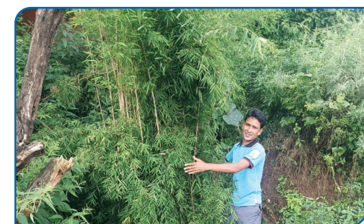
पार्की समुदायका युवाहरु निगालो खेतीको संरक्षण गर्दै