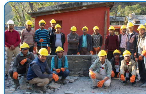
विपद् व्यवस्थापन तालिममा सहभागीहरु