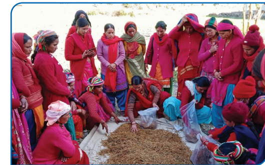
च्याऊ खेती तालिममा महिलाहरु सहभागी