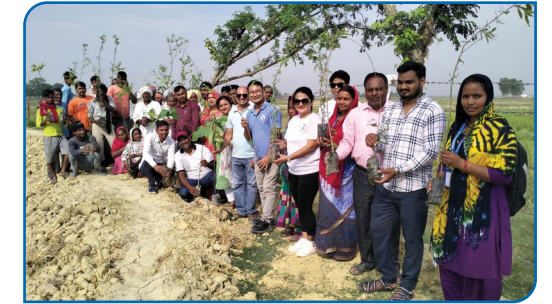
विश्व वातावरण दिवसको उपलक्ष्यमा वृक्षारोपण गरिदै