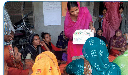
घरेलु हिंसा न्यूनीकरणका लागि जेण्डर च्याम्पियबाट अन्तरक्रिया कार्यक्रम