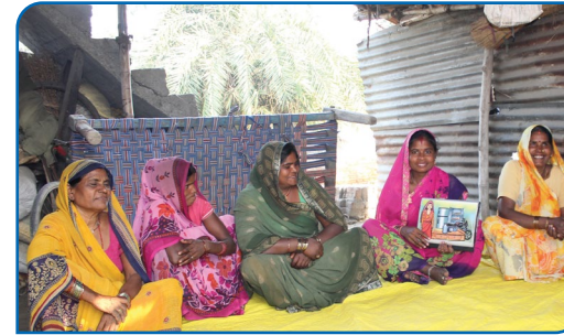
कोड विधिमाफत समूहको सहजीकरण गरिदै