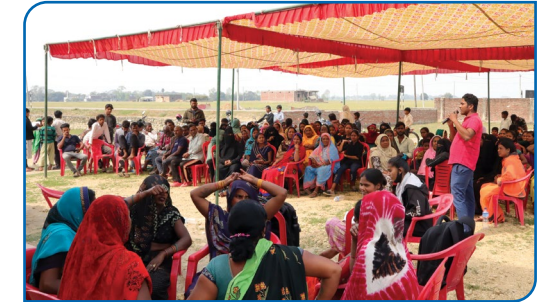
अन्तर्राष्ट्रिय महिला दिवसमा हाजिरी जवाफ प्रतियोगिता