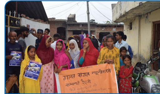
बालबालिकाको लागि गलत संगत न्यूनीकरण सम्बन्धि ज्ञानी