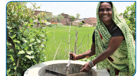
जलवायु परिवर्तन न्यूनीकरणको लागि गोवर ग्याँस प्लान्ट निर्माण