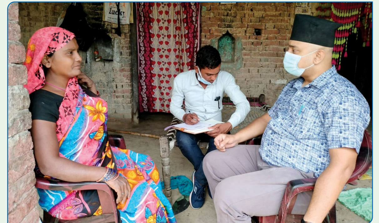
मनोचिकित्सकबाट घरभेट गर्दै

अन्तमा, यू.एम.एन. कपिलवस्तु क्लष्टर कार्यालय अन्तर्गतका परियोजनाहरूद्वारा यस वर्ष सामुदायिक विकास, मानसिक स्वास्थ्य सचेतना, यूवा सशक्तिकरण, लैङ्गिक समानता, अपाङ्गता समर्थन र घरेलु हिंसा रोकथाममा निर्णायक भूमिका खेलेको छ । हाम्रा अनवरत प्रयासहरू, साभेदार संस्थाहरूको मेहनत, स्थानीय सरकारको समन्वय तथा दातृनिकायहरूको निरन्तर सहयोगको कारण यस क्षेत्रका समुदायहरूको जीवन अझ उज्यालो, भन्नु समावेशी र थप आत्म निर्भरता सहितको सुन्दर भविष्यतर्फ अघि बढीरहेको हुनेछ, भन्नेमा हामी आशावादी छौं ।